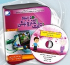
تکلیف الکترونیکی مدرسه (تام)