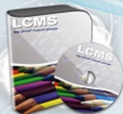
سیستم مدیریت آموزش نفیسا